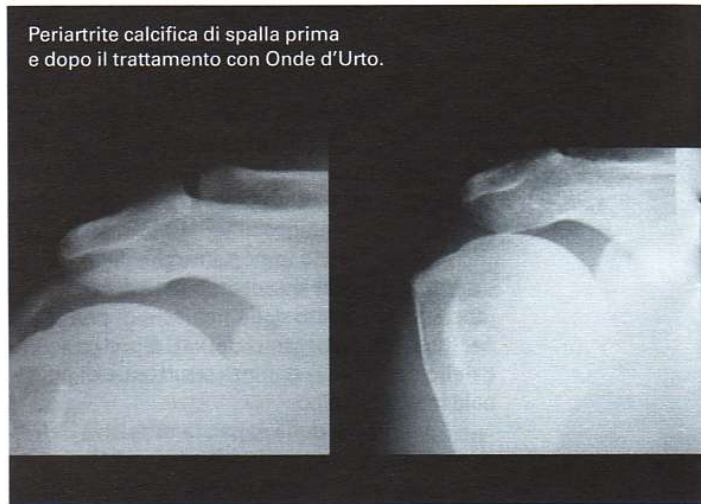
Periartrite calcifica di spalla prima e dopo il trattamento con Onde d'Urto.