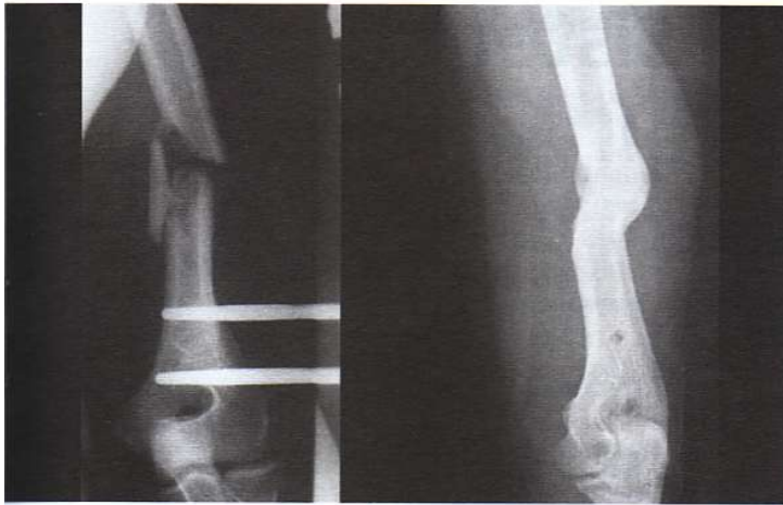
Pseudoartrosi di omero prima e dopo il trattamento con Onde d'Urto.

nazionale. Ha in corso numerosi studi sperimentali, sia clinici che di laboratorio. Il nostro Servizio ha contribuito alla formazione, in questa disciplina, di numerosi medici italiani e di vari Paesi europei.